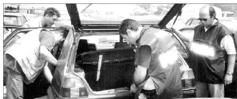
Un'auto adibita al trasporto di sigarette di contrabbando

«No smoking» - Successivamente all'arresto di Bosso, il 3 dicembre '99 Poli-