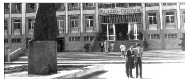
In tribunale a Bari il caso del ragazzo di Canosa