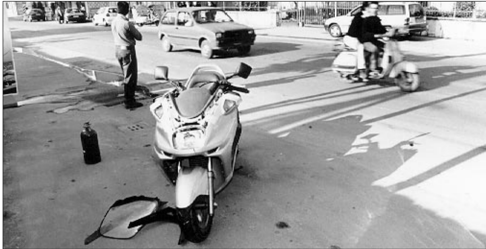
L'incidente avvenuto in via Andria: ferito un motociclista